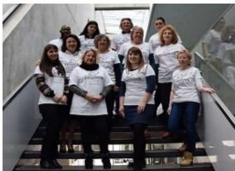
4ª Reunião do Projeto InnoWork, Kaunas, Lituânia

Se estiver interessado/a em obter mais informações e/ou como a sua PME poderá participar em breve num Workshop de divulgação do projeto, promovido pela AidLearn em Portugal, entre em contacto connosco.