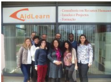
2ª Reunião do Projeto CREATUSE, Lisboa, Portugal

Na 2ª Reunião Transnacional do projeto, realizada na sede da AidLearn (15/16 de Abril de 2016), foram apresentadas as Boas Práticas de Economia de Partilha em Meio Urbano, recolhidas por cada um dos parceiros, que em breve estarão disponíveis online .